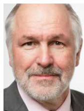
Hendrik Postma Vereniging van Waterbouwers